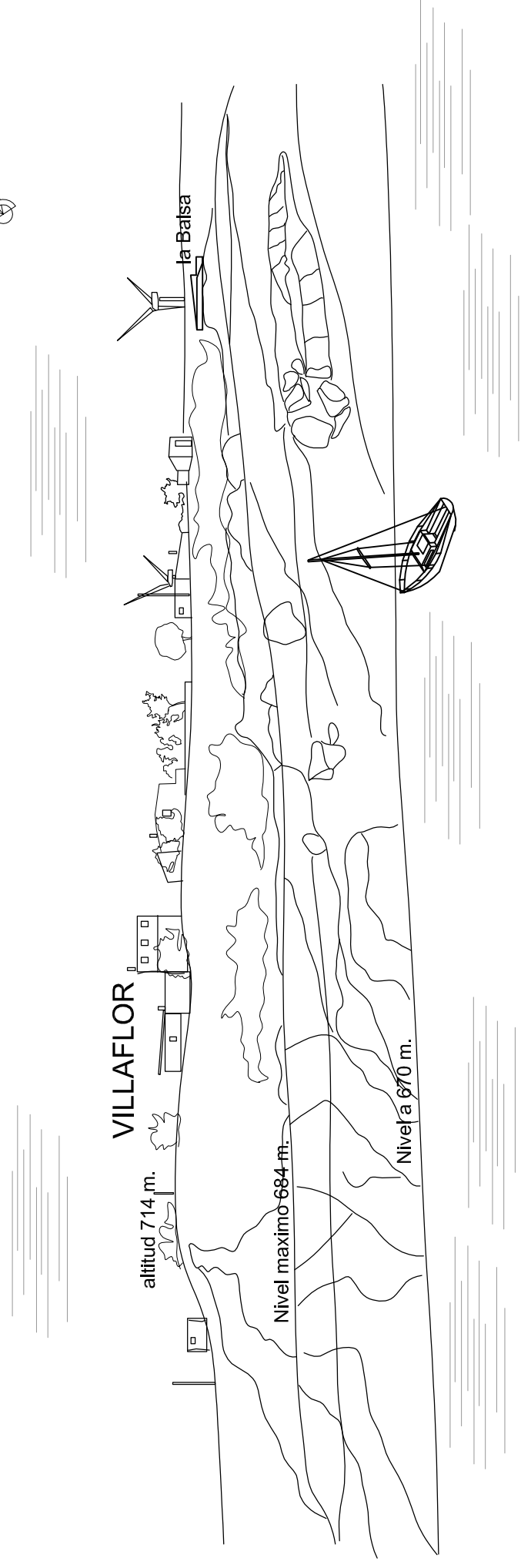
Bahía de la Villaflores